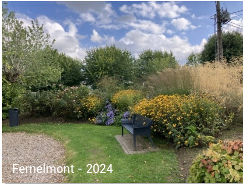
Fernelmont - 2024

celles déjà labellisées et nous espérons que ces exemples inspireront de nouvelles communes à rejoindre le mouvement en 2025 ! Ce label présente de nombreux atouts pour les communes : il offre un échange d'expériences et un accompagnement professionnel au cas par cas. Tant pour les visites que pour l'accompagnement qui suit la labellisation, nous tâchons de donner les outils techniques nécessaires au respect de l'environnement et de la nature. Nous veillons également à motiver les participants pour qu'ils augmentent la place accordée au végétal et favorisent le développement de l'économie locale tout en préservant des liens sociaux au sein des espaces publics. »