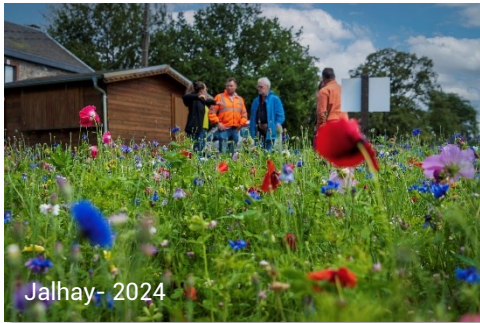
Jalhay - 2024